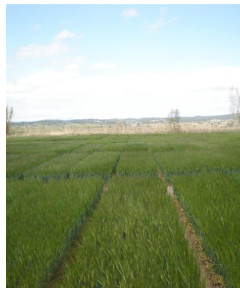
Figura 3. Assaig de varietats d'ordi de primavera. Campaña 2015-16.