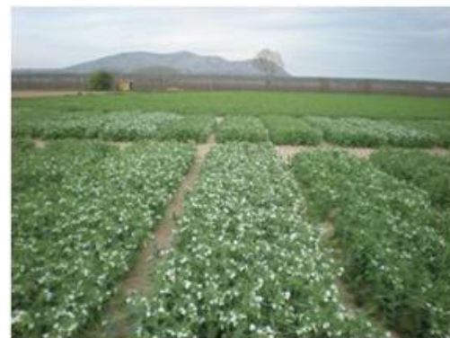
Assaig de varietats de pèsol de primavera de la Tallada d'Empordà (el Baix Empordà). Campanya 2015-16.

La campanya 2015-16 cal destacar les varietats KAYANNE i AUDIT , encara que amb un comportament desigual depenent de l'assaig.