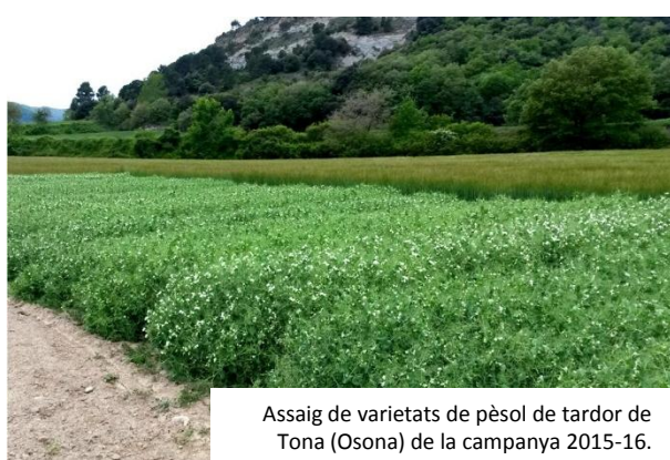
Assaig de varietats de pèsol de tardor de Tona (Osona) de la campanya 2015-16.

Durant la campanya 2015-16 cal destacar el bon comportament de la varietat FRESNEL a totes les localitats d'assaig. També cal remarcar la productivitat d'INDIANA , AVIRON , CURLING , BALLTRAP , etc.