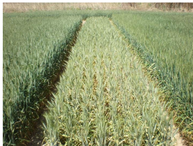
Figura 1. Descens productiu de les varietats més afectades per rovell groc als assajos de varietats de la Tallada d'Empordà a les campanyes 2015 i 2016, amb el % de superfície foliar afectada mitjana en cada cas.