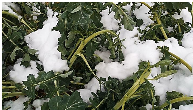
Foto 3 i 4. Camps nevats de colza a Calonge de Segarra (a 650m d'altitud).