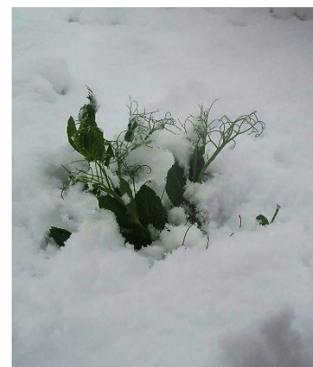
Foto 1 i 2. Camps nevats a la zona de Sanaüja (a 400m d'altitud).