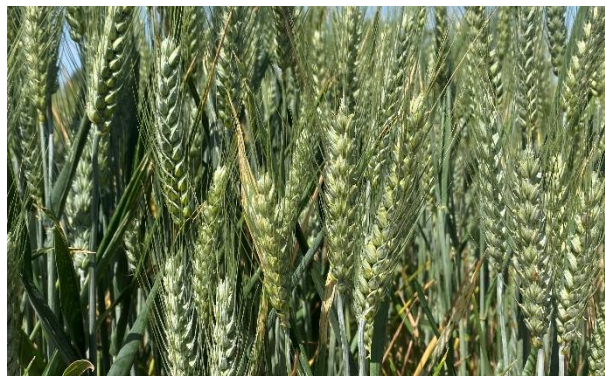
Figura 2. Índex productiu mitjà dels anys 2020, 2021 i 2022 als secans semifrescals (SSF), secans frescals (SF) i Girona interior (GI)